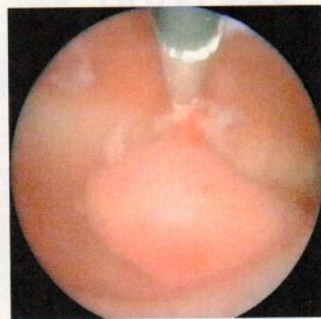
ENDOMETRIÁLNÍ POLYP vyrůstající ze zadní stěny děložní.

Ročně je na našich pracovištích provedeno přibližně 1500 těchto ambulantních zákroků, přijíždějí k nám pacientky z celé republiky, ale také ze zahraničí. Je to však celosvětový trend, kdy díky modernější metodice a zvyšující se erudici lékařů se jednodušší výkony přesouvají z nemocnic do ordinací praktických gynekologů. Ambulantně tak lze provést velkou většinu hysteroskopických zákroků.